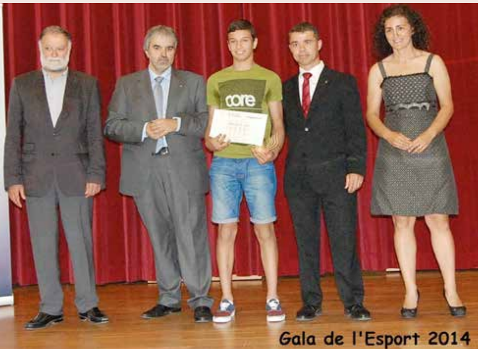
Gala de l'Esport 2014

Magnífic colofó a la gran tasca feta pel Club Judo Els Pallaresos durant tota la temporada, aconseguint grans èxits esportius tant a títol individual com col·lectiu.