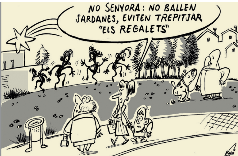
Imatge del Bim de desembre del 2010, que denota una problemàtica existent.