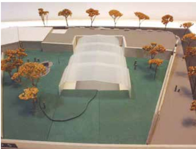
Imatge de la maqueta de la reforma de la piscina.

El mes de març ha estat una data clau per donar el tret de sortida a la nova aposta de l'ajuntament. La redacció del projecte de remodelació, rehabilitació i ampliació de la piscina municipal ja està en marxa.