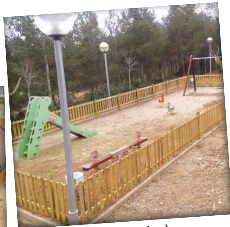
Parc infantil del carrer Pallars Jussà.