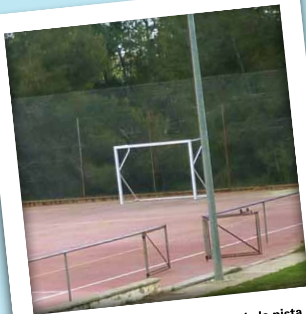
Reparació de la tanca metàl·lica de la pista esportiva de Pallaresos Park