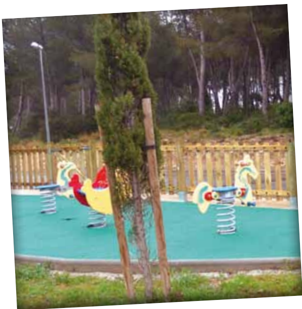
Tanca de fusta a la zona infantil de Pallaresos Green