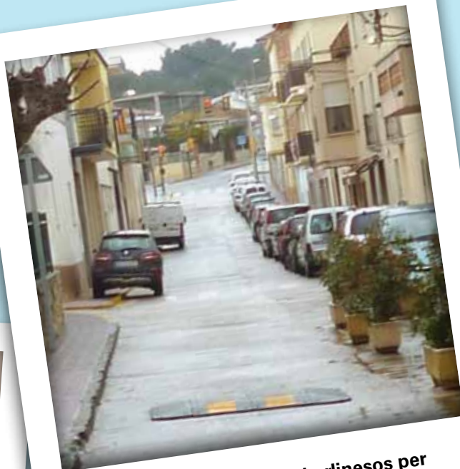
Instal·lació de coixins berlinesos per millorar la seguretat vial