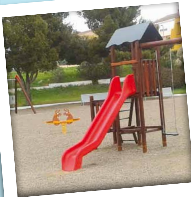
Millora dels elements de joc al parc infantil de Francesc Macià