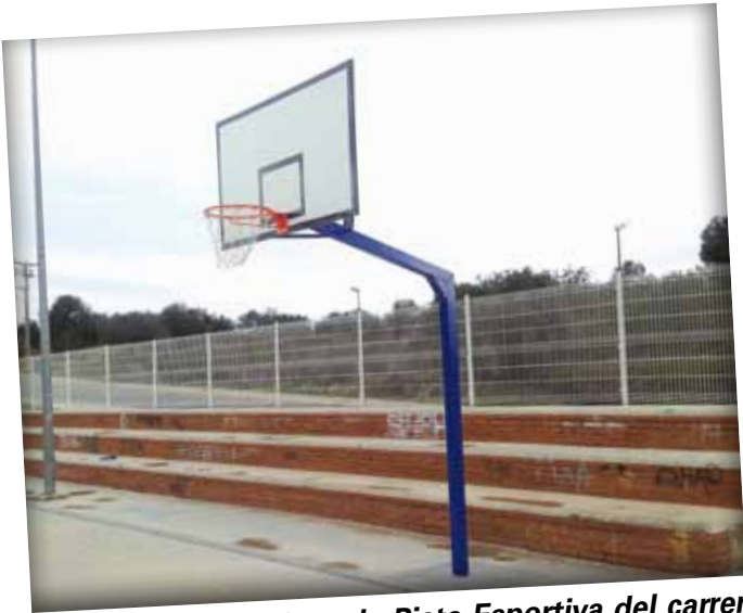
Cistelles instal·lades a la Pista Esportiva del carrer Onze de setembre i a la zona esportiva d'Hostalets.

Arran de les subvencions atorgades per la Diputació de Tarragona en el Pla d'Acció Municipal 2012, l'ajuntament ha invertit 34.853,87€ en la millora dels parcs infantils del nostre municipi. L'actuació s'ha centrat en tres zones concretes: Plaça Constitució, zona infantil del carrer Pallars Jussà i zona infantil davant del camp de futbol municipal.