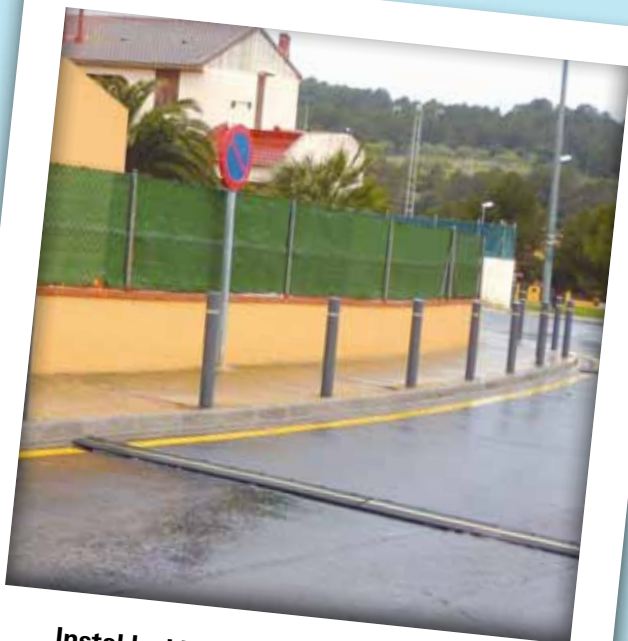
Instal·lació de pilones per evitar que aparquin els cotxes a les voreres dificultant el pas dels vianants