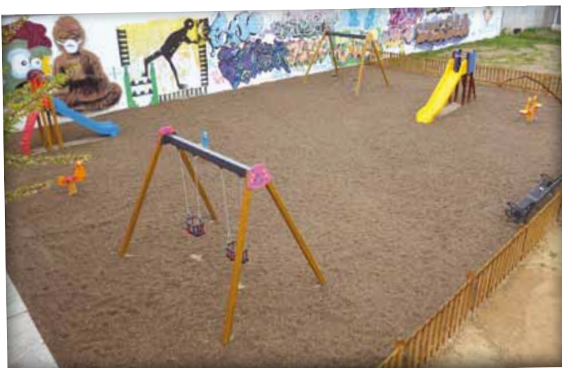
Parc infantil de davant de la zona esportiva d'Hostalets.

POSEM L'ACCENT EN ELS MUNICIPIS Pla d'Acció Municipal - PAM