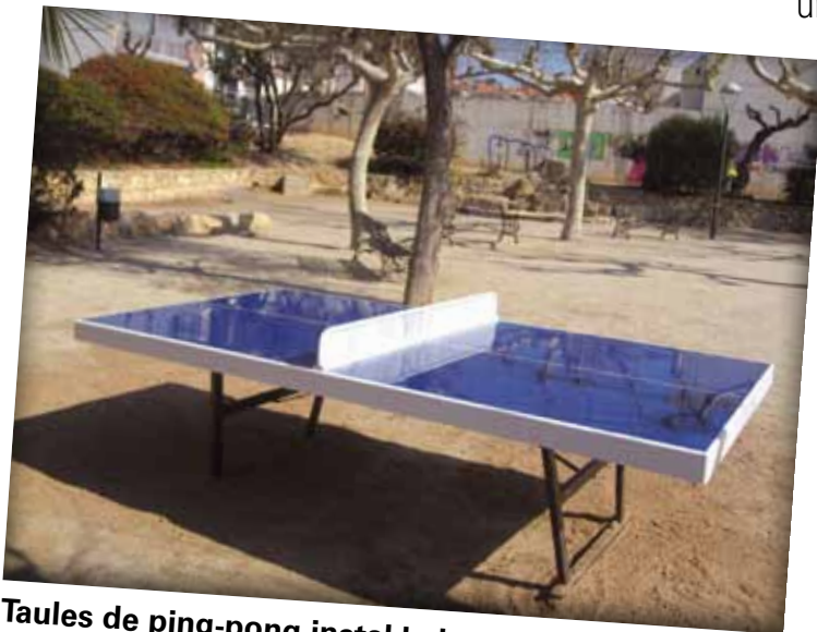
Taules de ping-pong instal·lades a la Font de la Mina i a la zona esportiva d'Hostalets.

Paral·lelament, i per tal de fomentar l'esport, als espais públics s'han instal·lat dos jocs de cistelles de bàsquet i dues taules de ping-pong, que han estat tot un èxit entre el jovent.