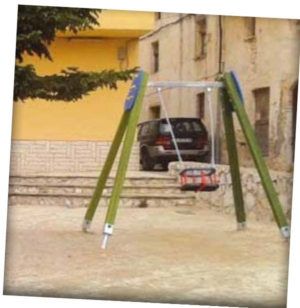
Instal·lació d'un nou element de joc al parc de La Caixa

Una vegada més hem de ser conscients que una petita inversió, comporta una gran millora, en aquest cas, en la seguretat dels nostres veïns.