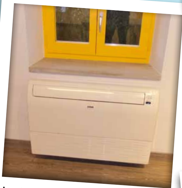
Instal·lació d'aire condicionat al Centre Jujol, Jubilats i Colla Gegantera.