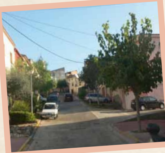
Carrer Major (Any 1972 i 2011).