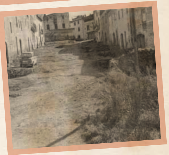
Carrer Raval (Any 1972 i 2011).