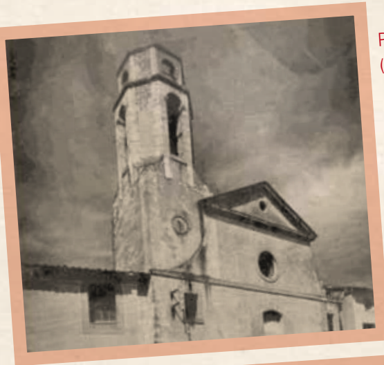
Plaça de l'Església (Any 1949 i 2011).